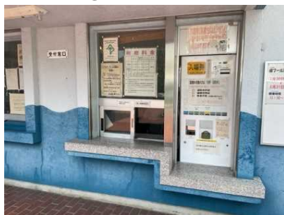
受付カウンター高さ81cm