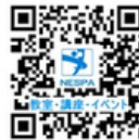
「枇杷島スポーツセンター」をクリック

■インターネットによるお申込みは https://ttzk.graffer.jp/city-nagoya