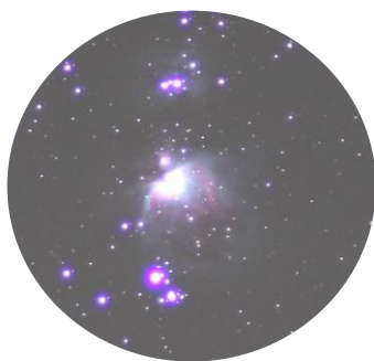
オリオン座大星雲