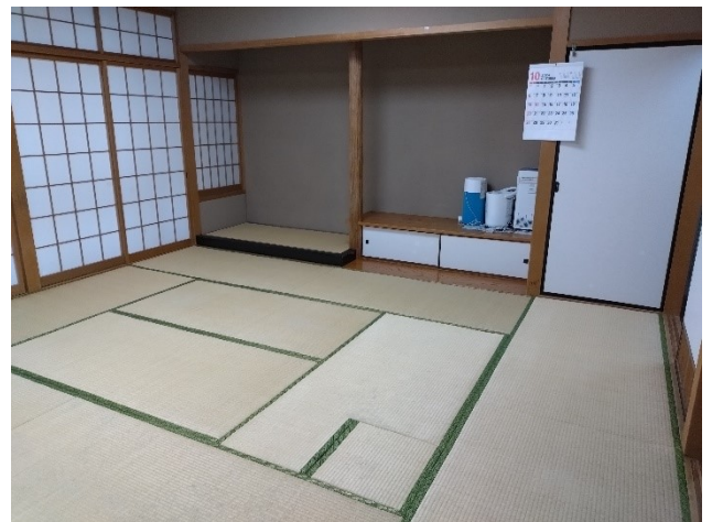
和室入口 左:第2和室 中央:共有スペース(5畳) 右:第1和室