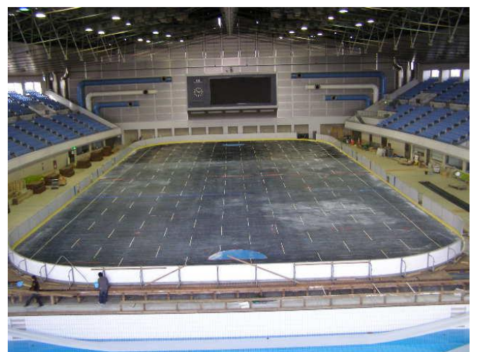
4 リンクを囲うフェンスを取り付けます