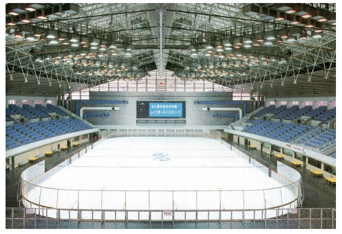
6 表面を白く塗装し、ラインを入れ、さらに水を撒いて氷を厚くしていく 厚さ約5センチに製氷し、完成