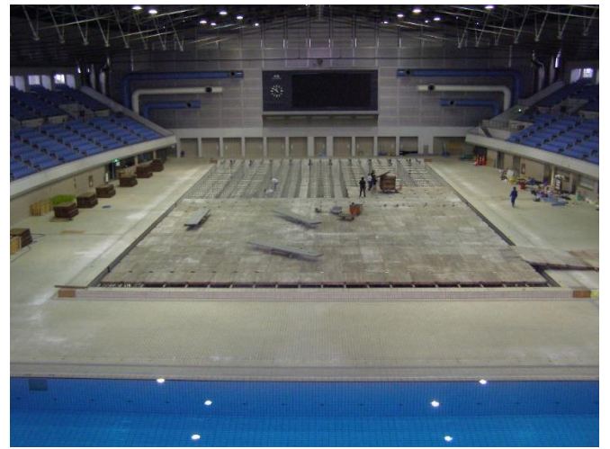
2 鉄骨の上に床板を敷き詰めます