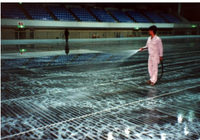
5 ホースで霧状の水を撒き、凍ったら再度散水する作業を繰り返します