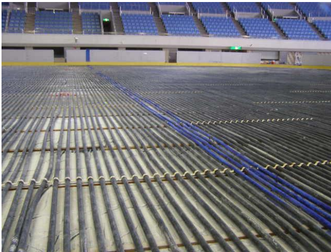
3 氷を作るためのパイプを敷き詰めます (不凍液を循環させる管 751本)