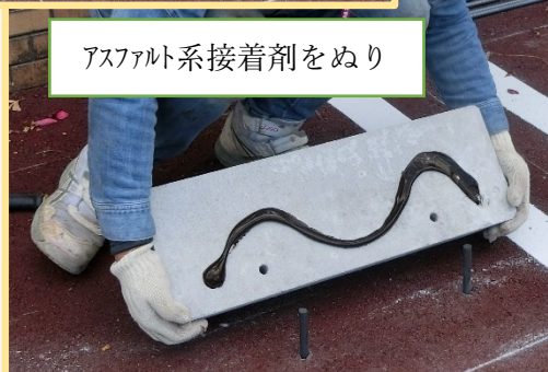
アスファルト系接着剤をぬり