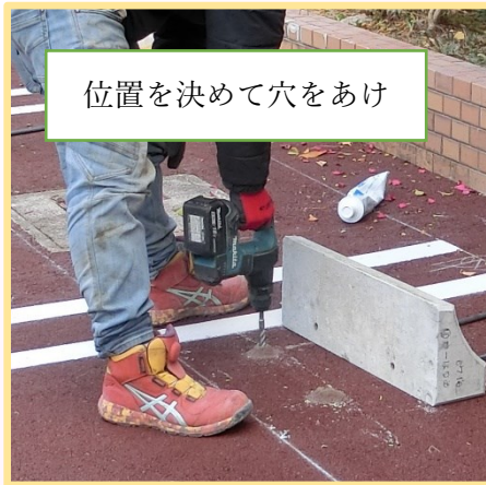
位置を決めて穴をあけ