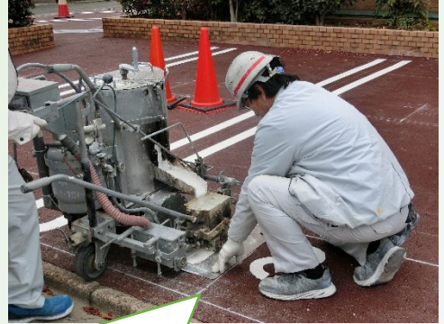
駐車場 NO をペイントしているところ。塗布材は200度に熱しているのだそうです。