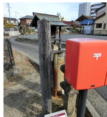
いもかわうどんの碑