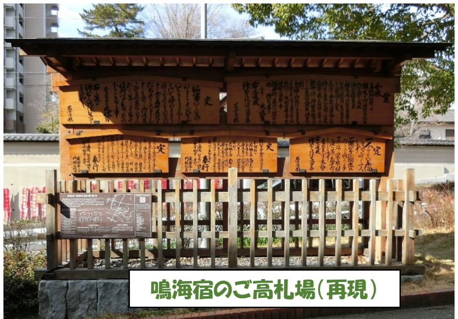
鳴海宿のご高札場(再現)