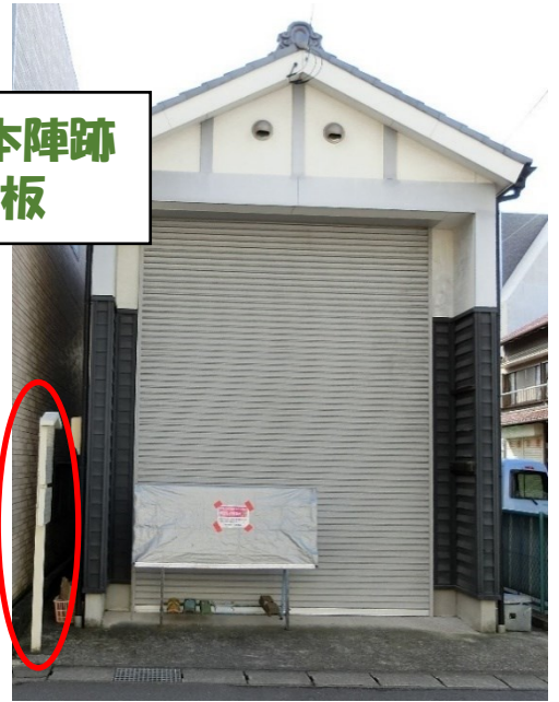
鳴海宿本陣跡 案内板