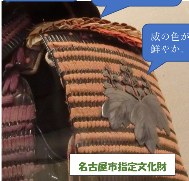
名古屋市指定文化財