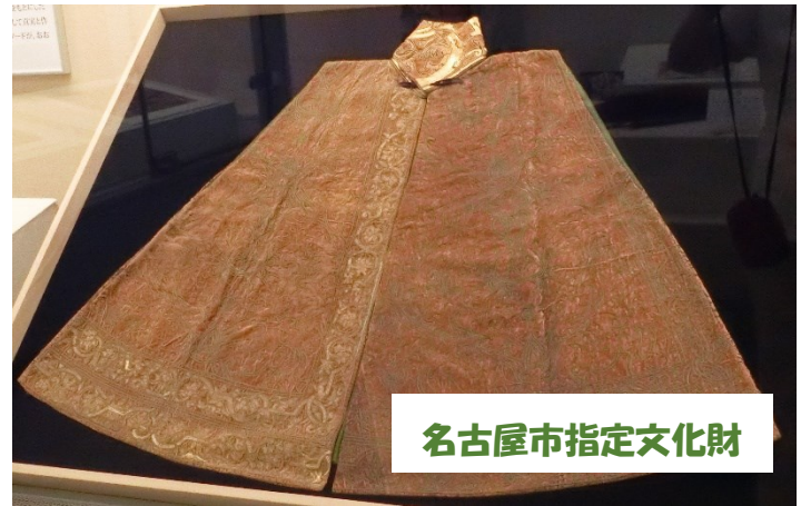
名古屋市指定文化財

秀吉が着ていたといわれるビロードの陣羽織。南蛮図屏風からめけ出てきたかのようなマント風です。