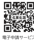
電子申請サービス

名古屋市電子申請サービス をクリック →「名東生涯学習センター」と入力してください